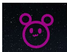
うーたんの花火ができた